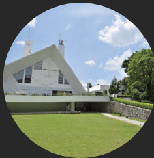
サビエル記念聖堂