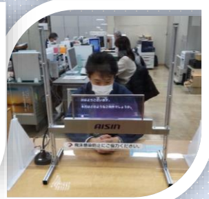
窓口相談支援システム