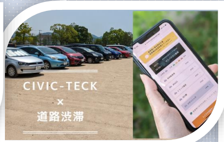
シビックテック・レノファプロジェクト デザインシンキングカレッジ